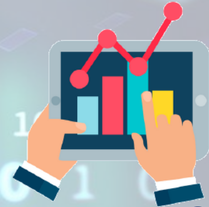
Arrastrar y Soltar